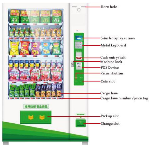
Vending Machine Appearance Display 1